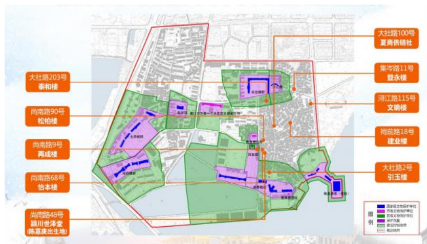
图 1 集美学村历史文化街区示意图

综合开发、配套建设”的原则，统筹规划。为改造小区配置监控、规划地面停车位、增设无障碍通道，提高居民生活出行的安全感和舒适度。结合文创旅游街区建设，推动颍川世泽堂（陈嘉庚出生地）、夏商供销社、建业楼、怡本楼、再成楼侨楼修缮，争取资金支持，探索引入社会资本，统筹大社文旅产业发展与风貌建筑保护。