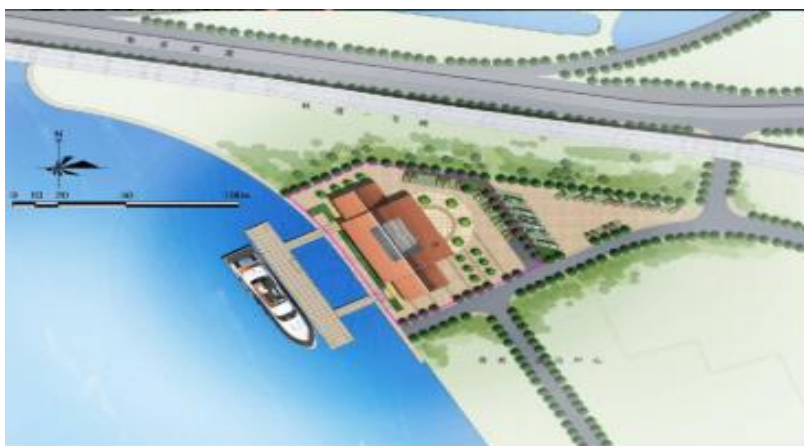
图 2 集美旅游码头设计效果图

街道需主动融入，全力推动集美旅游码头项目建设，争取 2025 年建设完成 2 个新客运泊位，开辟“鼓浪屿——集美”海上游与海上交通运输，增加集美游客总量，缓解陆路交通。